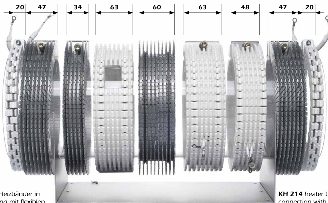
KH 214 Heizbänder in Verbindung mit flexiblen Kühlelementen KE 300